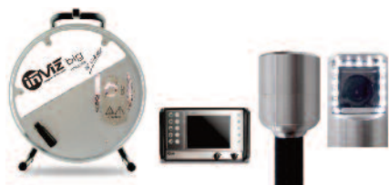
INVIZ® BIG 30