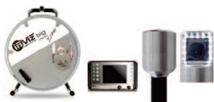
INVIZ® BIG 50