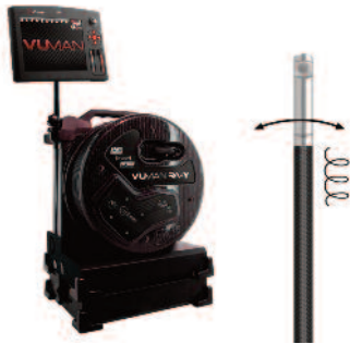
INVIZ® VUMAN® RA-Y 6/8 RF