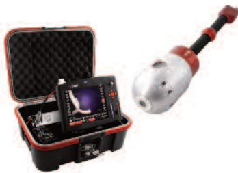
INVIZ® Revolver 80