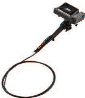
VUCAM® XO 6,6 m