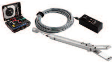
INVIZ® GR 16