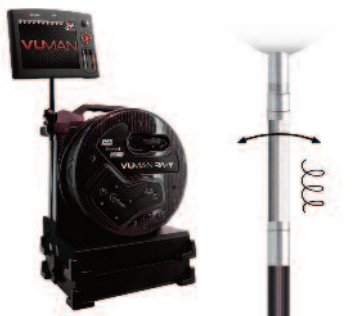
INVIZ® VUMAN® 8/15 RF