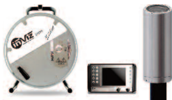
INVIZ® Pipe 30