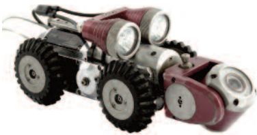
iPEK® 125 Fahrwagen