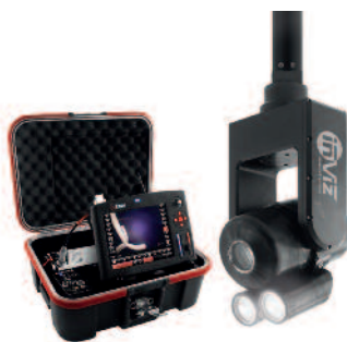
INVIZ® SNK 36x