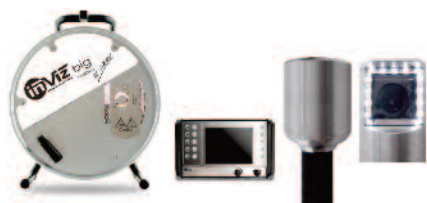
INVIZ® BIG 80