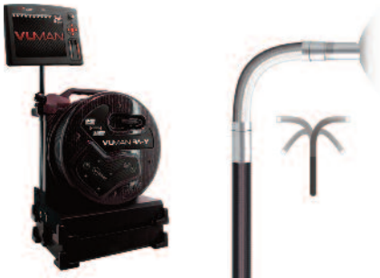
INVIZ® VUMAN® 8/5 RF X-WAY