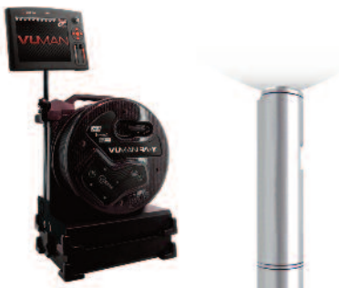
INVIZ® VUMAN® RA-Y 6/8 Weitwinkel