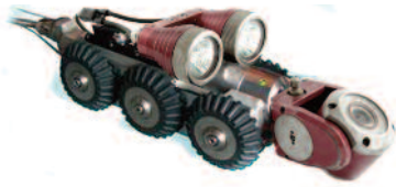
iPEK® 100 Fahrwagen