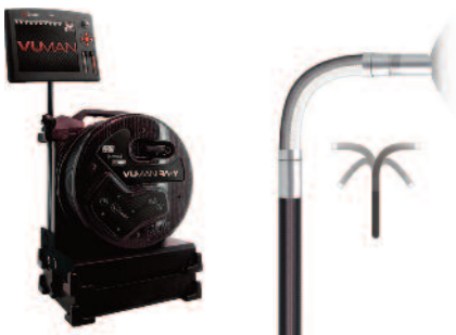
INVIZ® VUMAN® 8/8 RF X-WAY