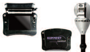
Kummert Smart Cam