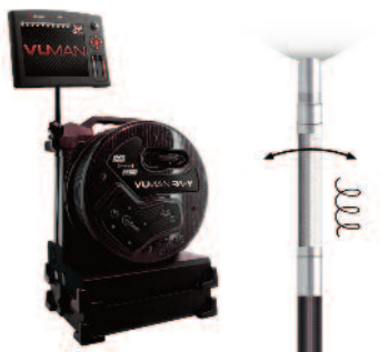
INVIZ® VUMAN® 8/8 RF